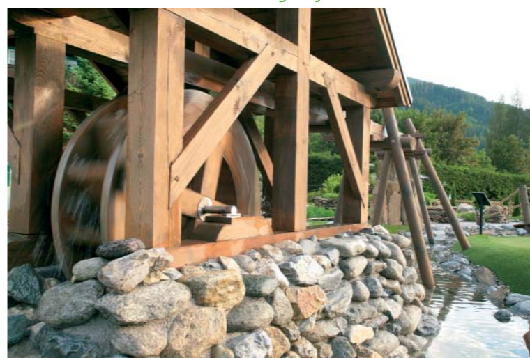
Liebe zum Detail: Wasserrad inmitten des Golfplatzes.