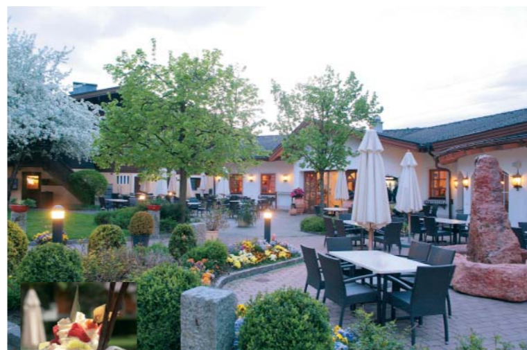
Die schöne Terrasse beim Sportcamp Woferlgut lädt zum Verweilen ein.

Nach dem Abenteuer Golf (auch als Firmenevent eine ideale Möglichkeit) empfiehlt sich die Einkehr auf die schöne Terrasse oder in das Gastlokal. Aufgetischt werden lokale Spezialitäten und internationale Schmankerl genauso, wie deftige Hausmannskost. Eisliebhaber kommen ebenso auf ihre Rechnung, wie die Kinder, für die es einen großen Spielplatz im Grünen sowie einen Indoorspielbereich gibt. ■